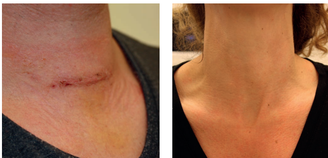
Links: Narbe nach Fadenzug; rechts: verheilte Narbe nach ca. einem Jahr.

Nachdem die Fäden gezogen worden sind, wird sich die Narbe weiter verändern. Das Narbengebiet kann nach dem Fadenzug zunächst noch verhärtet und geschwollen sein. Die frische Narbe sollte vor mechanischen Störungen (z. B. Halskette) und vor Sonnen- und UV-Strahlung geschützt werden. Diese Vorsichtsmaßnahmen tragen zur einer optimalen Wundheilung bei.